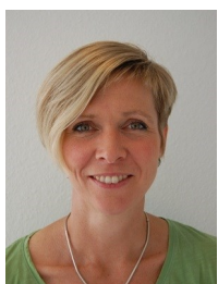
Helle Weile Larsen Vrå skole