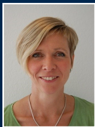
Helle Weile Larsen Vrå Skole