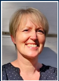
Lise Steiniche Bjergby Skole