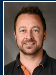
René Borup Dehn Torslev Skole